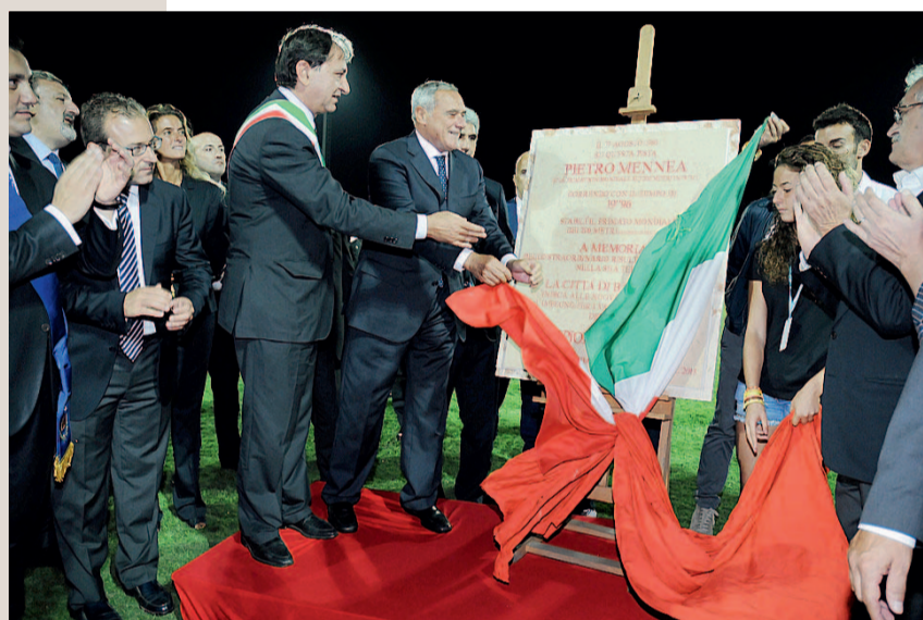
LA FRECCIA DEL SUD In alto, Pietro Mennea. A sinistra, la cerimonia commemorativa con il presidente del Senato, Pietro Grasso, al «Mennea day» dello scorso 12 settembre, a Barletta

gno. Pensi se qualcuno, a metà degli anni Sessanta, avesse detto: "Il recordman dei 200 metri dal 1979 al 1996 apparterrà ad un barlettano".